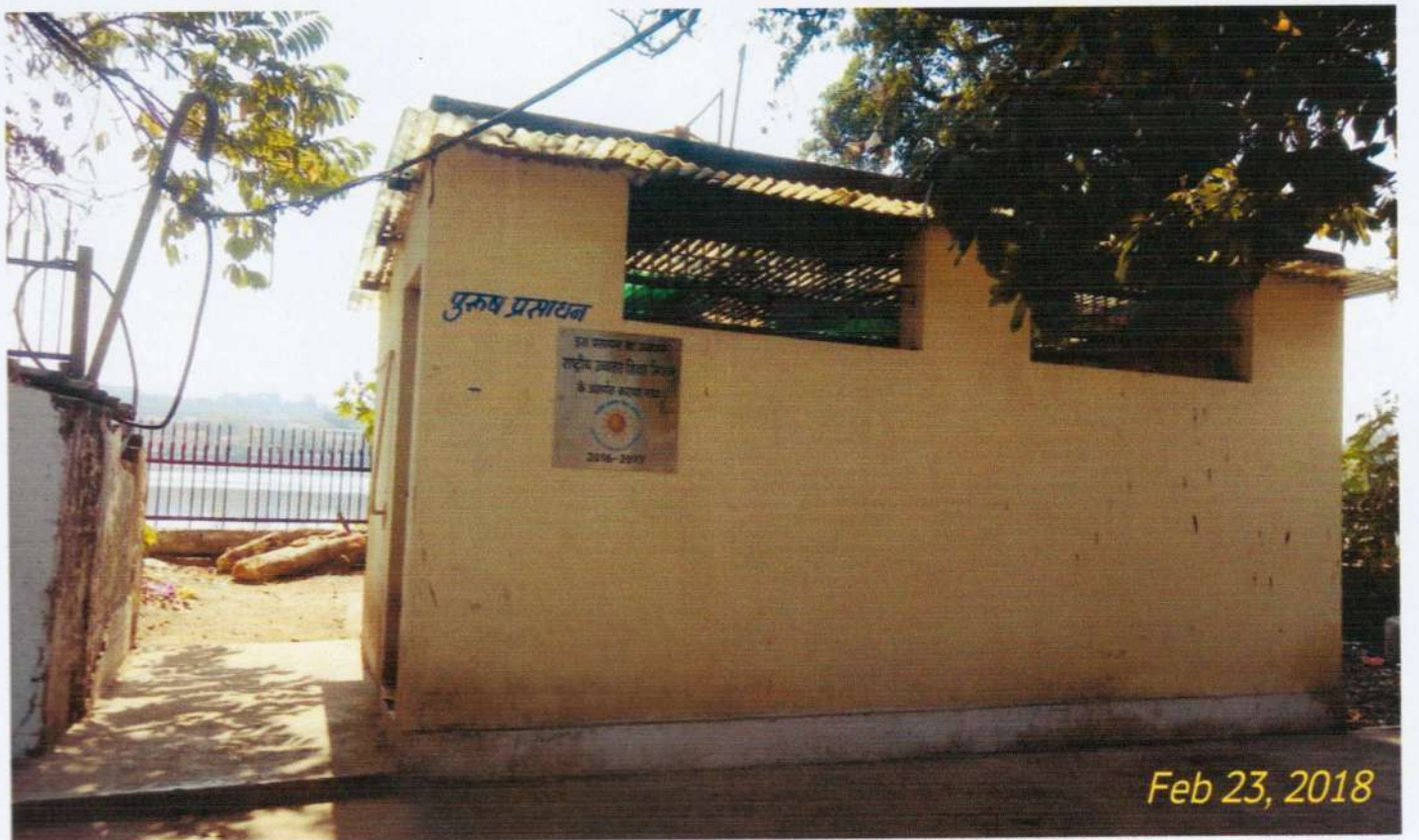
पुरुष प्रसाधन, ए-ब्लॉक