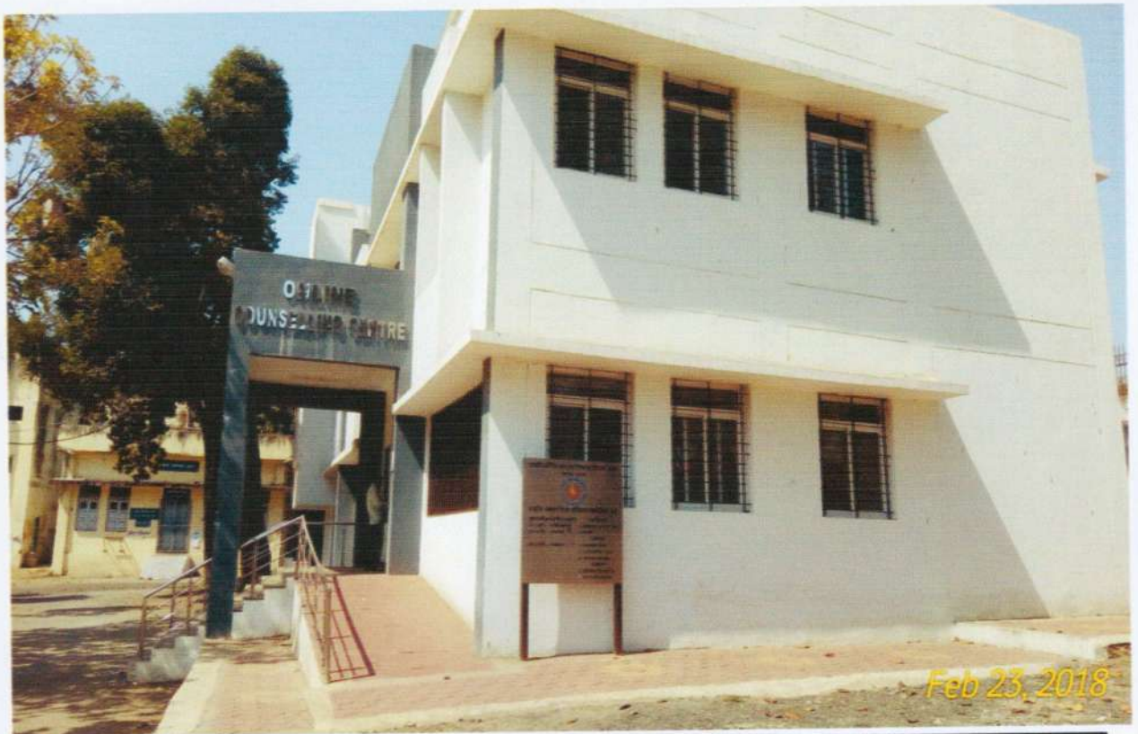
नवनिर्मित ऑनलाईन काउन्सिलिंग केन्द्र पार्श्व