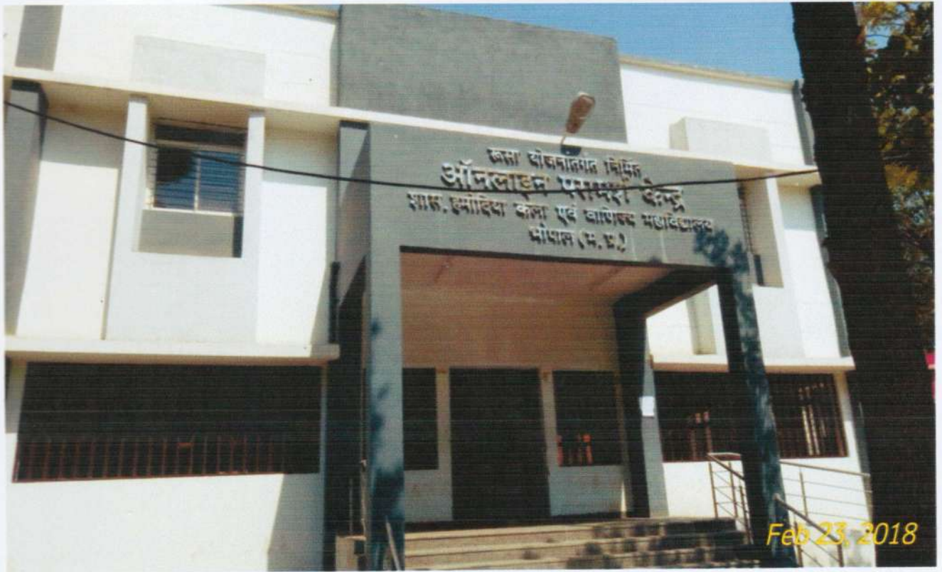
नवनिर्मित ऑनलाईन काउन्सिलिंग केन्द्र