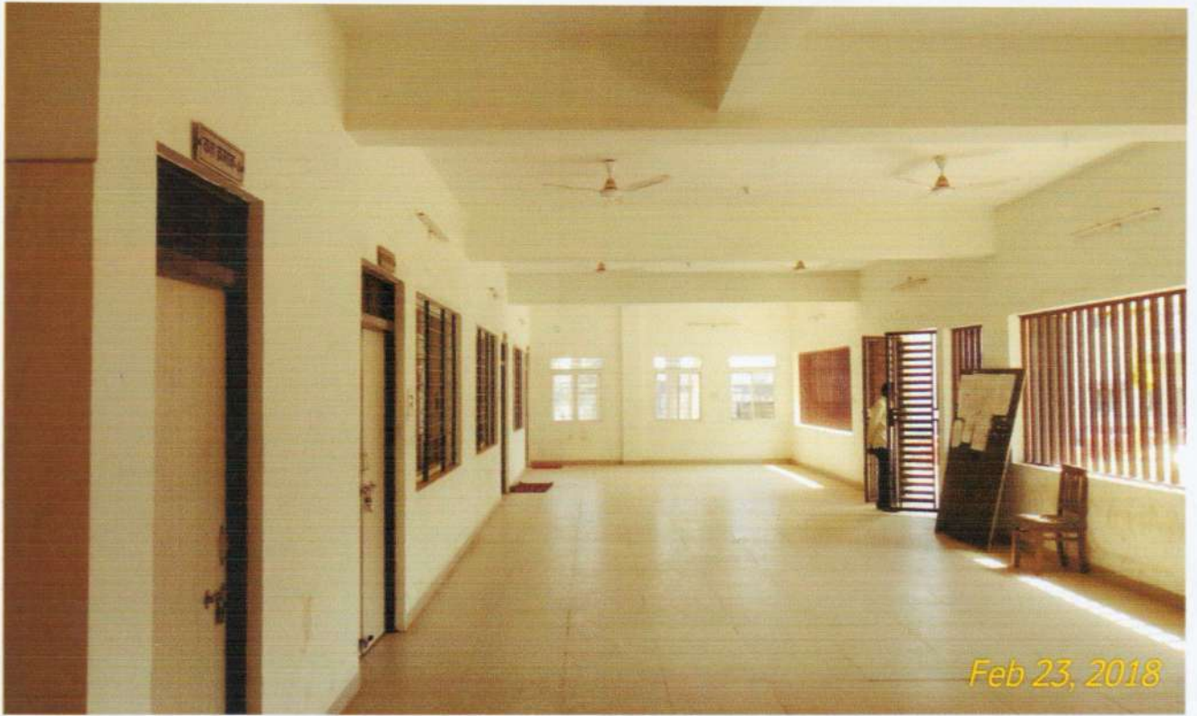
ऑनलाईन काउन्सिलिंग केन्द्र के विभिन्न कक्ष