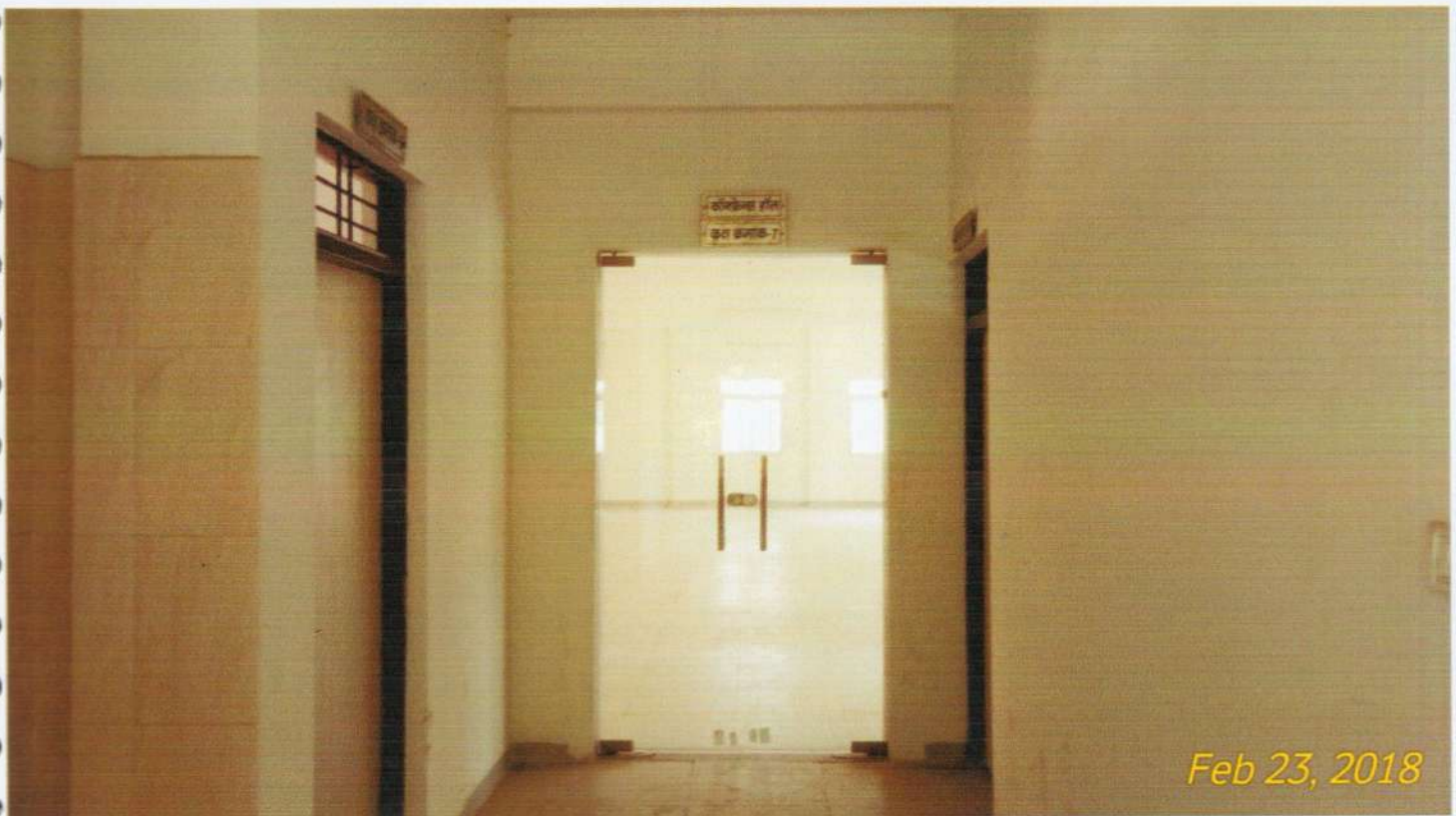
ऑनलाईन काउन्सिलिंग केन्द्र का सभागार