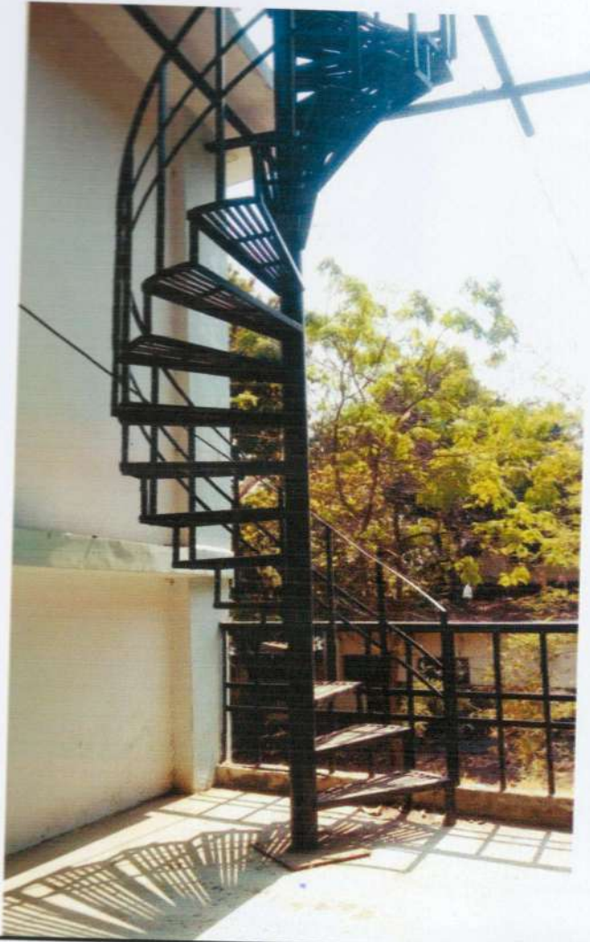
कम्प्यूटर लैब के ऊपर जाती सीढ़ियाँ