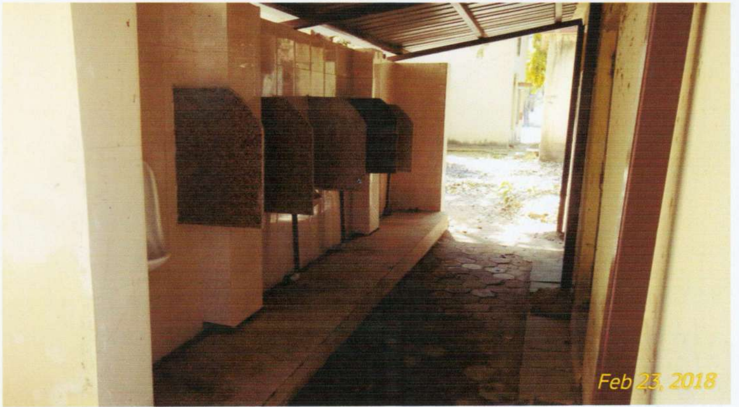
पुरुष प्रसाधन, पी ब्लॉक