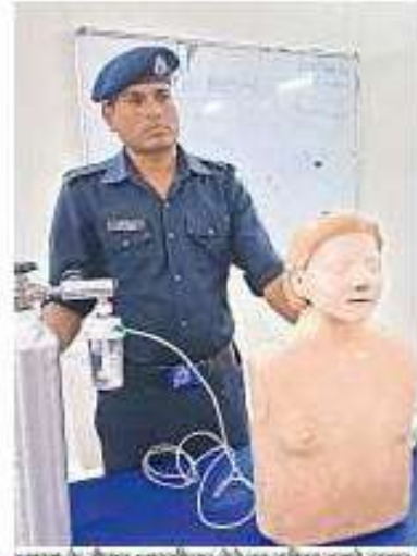
आपदा के दौरान आदरसौजन्य देने का तरीका बताते जवान।

प्रदान की जाएगी। आपदा मित्र योजना की शुरुआत राष्ट्रीय आपदा प्रबंधन प्राधिकरण के तहत की गई थी। इस योजना के तहत युवा निस्वार्थ भाव के साथ अपने साहस और शौर्य का परिचय देंगे।