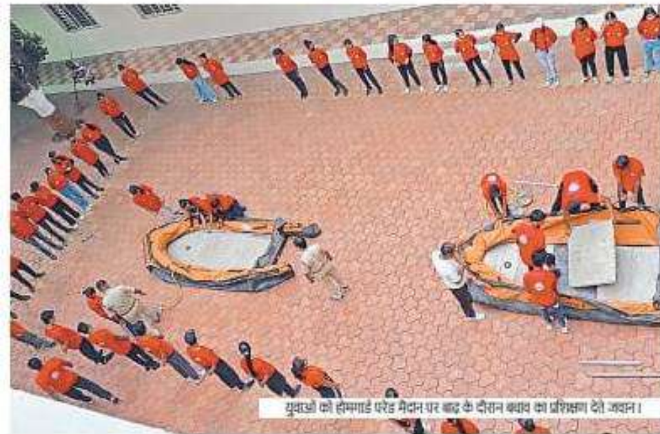
युवाओं को होम्सगार्ड परेड मैदान पर बंदूक के दौरान बचाव का प्रशिक्षण देते जवान।

प्रदेश में अभी तक 11 जिलों में आपदा मित्र योजना के तहत युवाओं को प्रशिक्षण दिया जा चुका है, जिसमें भोपाल, दरिया, दमोह, उज्जैन, रायसेन, विदिशा, सिंगरीली, बड़वानी, गुना, खंडवा आदि शामिल हैं। यहां से 3300 युवाओं को आपदा मित्र बनाया गया है, जो समय-समय पर अपनी उपयोगिता को साबित करते हैं। इस योजना के तहत सिर्फ युवाओं को ही प्रशिक्षण दिया गया है, जिसमें महिला और पुरुष शामिल हैं।