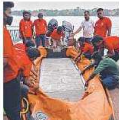
बड़ा तालाब में बोट बनाने व चलाने का प्रशिक्षण लेते युवा।