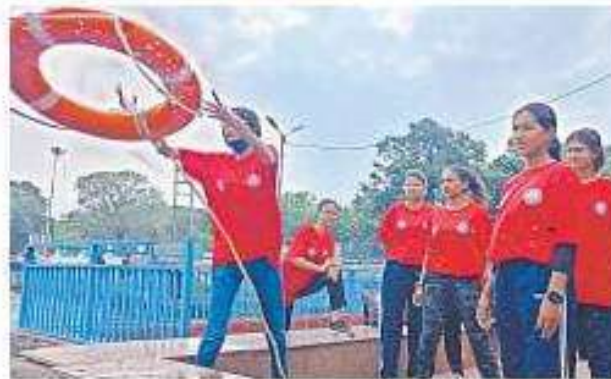
छोटे तालाब में बंदूक से लोभ को बचाने की तरकीब सीखती युवतियां।