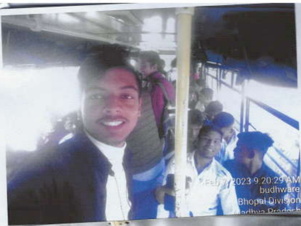
Feb 7, 2023 9:20:29 AM budhware Bhopal Division Madhya Pradesh