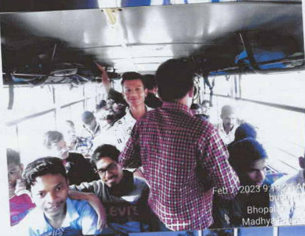
Feb 7, 2023 9:19:21 AM budhware Bhopal Division Madhya Pradesh